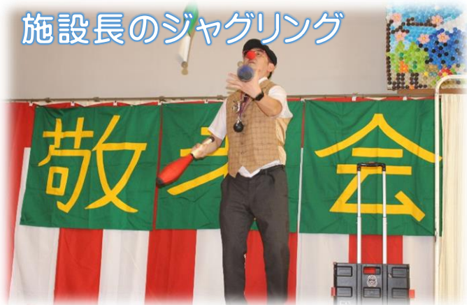
施設長のジャグリング